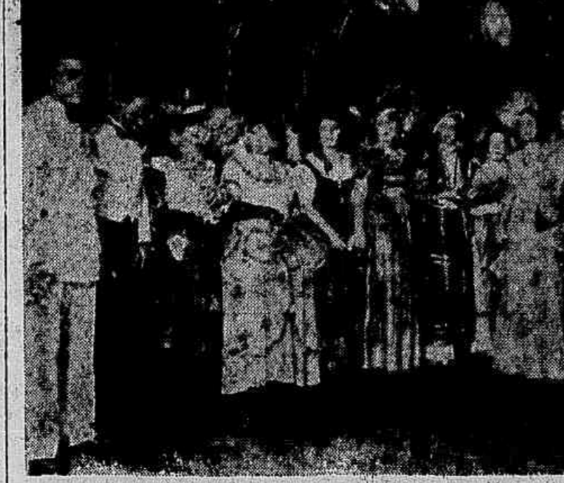
Lindas fantasias exibidas no baile do Municipal.

Foi grande o numero de turistas estrangeiros presentes ao baile. A impressão recebida pela unanidade delles — e confessada a elementos da commissão executiva — foi a de que se tratava de uma das festas mais bellas e bem organizadas do mundo.